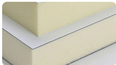
دانلود PDF این مقاله

ساندویچ پانل‌ها در واقع متريال‌هایی هستند که امروزه استفاده آن‌ها در ساختمان سازی بسیار دیده می‌شود. این دسته از متريال‌ها که به نام ساندویچ پانل ساختمانی شناخته می‌شود، امروزه کاربرد بسیاری دارند و همین دلیل باعث شده تا اشکال مختلفی از این دسته از موادها ارائه شود. در این مقاله با ما همراه باشید تا به شما انواع کاربردهای ساندویچ پانل‌ها مانند ساندویچ پانل سقفی و ساندویچ پانل دیواری را در زمینه ساختمان سازی ارائه دهیم و شما را با کاربرد اجرای ساندویچ پانل و ساندویچ پانل ساختمانی بیشتر آشنا کنیم.